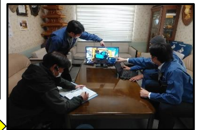
現場の様子を本社でリアルタイムで監視